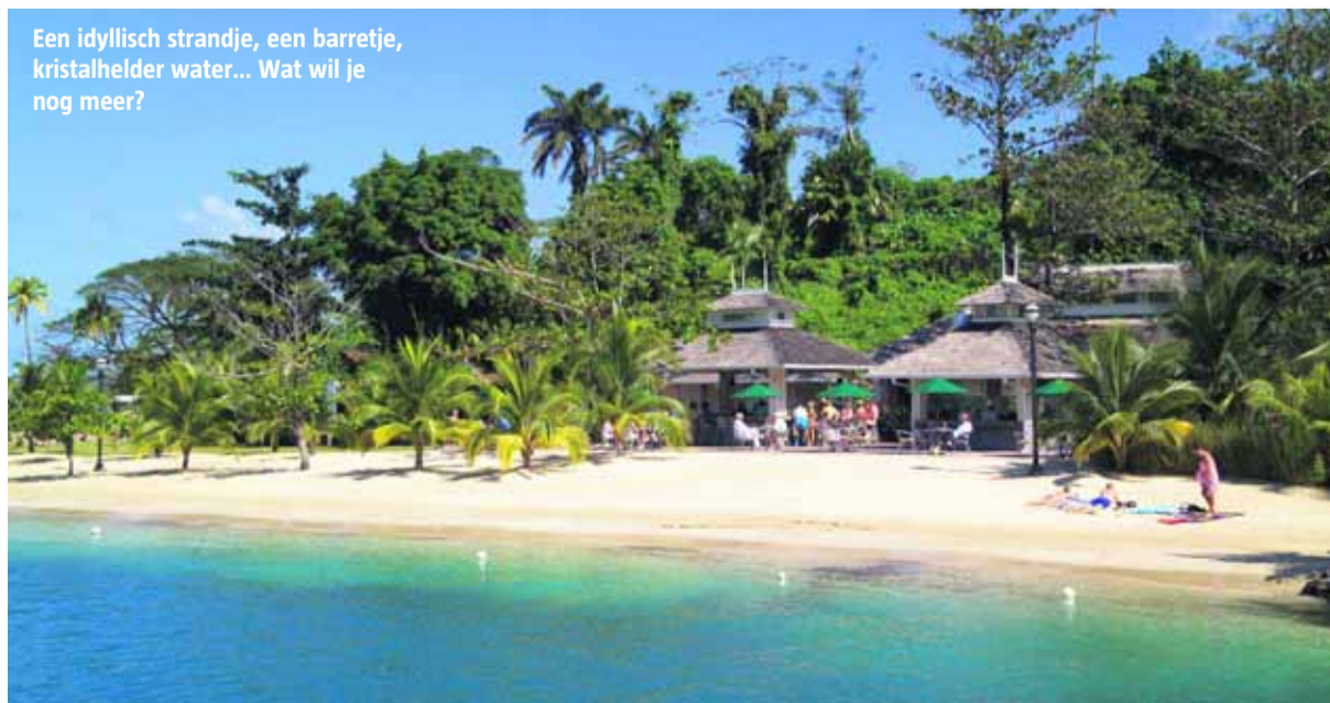
Een idyllisch strandje, een barretje, kristalhelder water... Wat wil je nog meer?